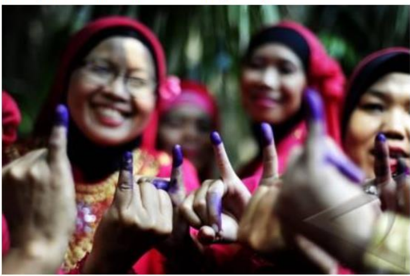
Masyarakat Indonesia Menuju Pilpres 2019

PEMILIHAN Presiden merupakan pemilihan calon kepala negara sekaligus kepala pemerintah di Indonesia & pemilihan Presiden tepatnya pada tanggal 17 April 2019, karena dalam pesta demokrasi kurun waktu 5 tahun sekali tentu harapan masyarakat sangat tinggi terhadap calon yang akan didukung maupun dipilih nantinya.